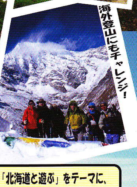
海外登山にもチャレンジ!