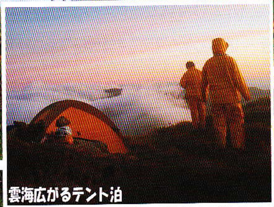
雲海広がるテント泊