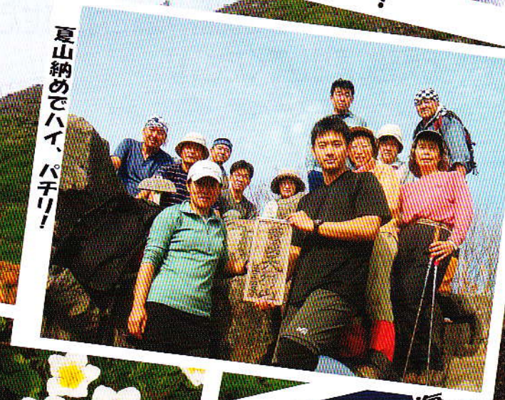
夏山納めでハイ、ハチリ!