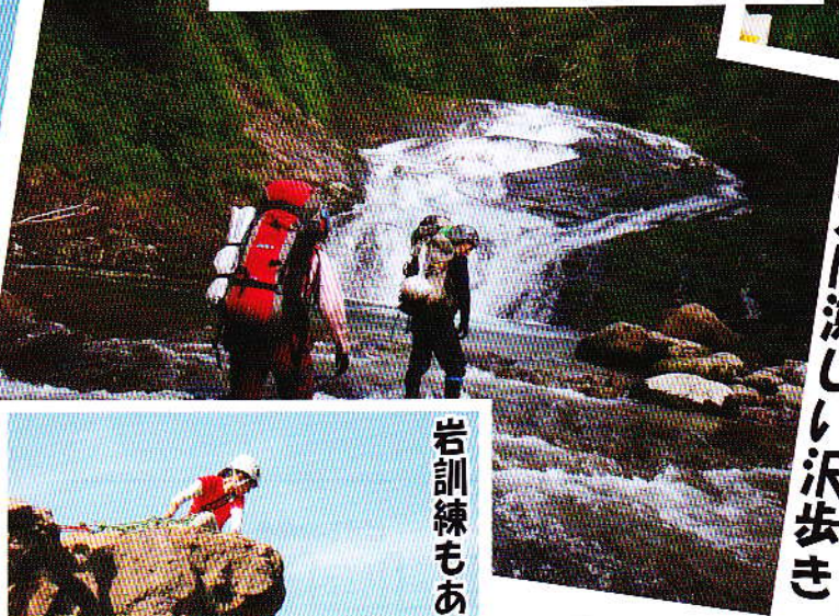
夏は涼しい沢歩き